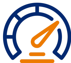
Plazos de entrega sensibles